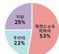
東日本大震災(平成23年3月) 総務省消防庁 [平成23年 火災発生(原因)を要約した作成]