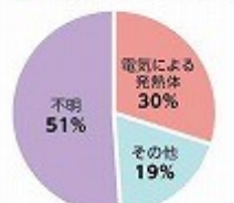
阪神淡路大震災(平成7年1月) 総務省消防庁 [平成7年 火災発生(原因)を要約した作成]