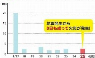
■通電火災発生件数 阪神淡路大震災(神戸)

感震ブレーカー は、地震を感知すると自動的に ブレーカーを落として電気を切ります。