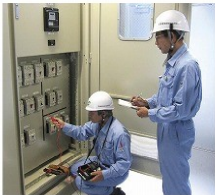
各負荷回路の絶縁抵抗測定

電気設備は経年劣化、温湿度、雷サージなどのストレス、さらに雨水やほこりによる汚損等により、機能や性能が損なわれます。